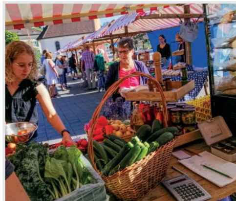
Die Besucher sind begeistert vom Sortiment!