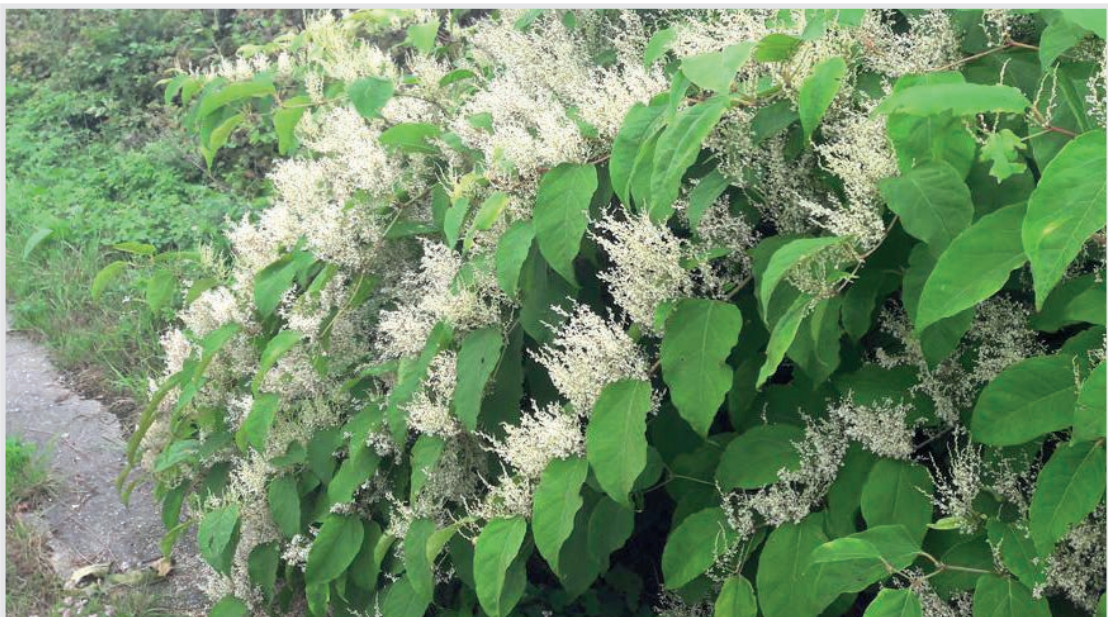
Japanische Staudenknöterich (Ausbreitung an Wasserläufen)

Diese Pflanzen gehören nicht in den Garten!