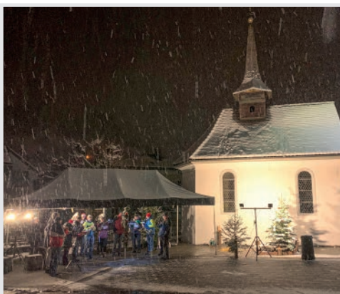
Darbietungen am weihnachtlichen Buuremärt!