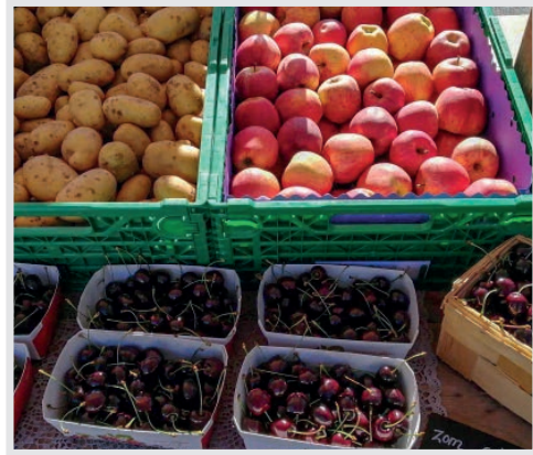
In diesem Jahr konnten wir viel ernten!