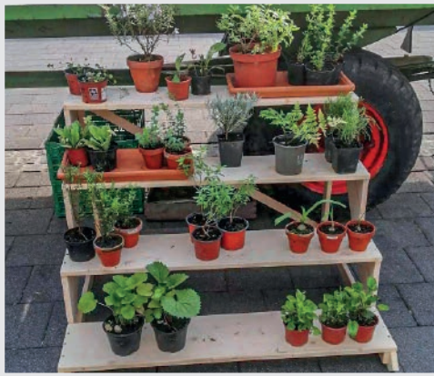
Kräuter- und Setzlings-Verkauf im Mai 22