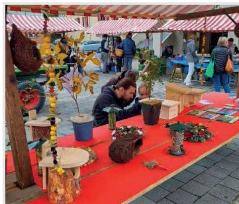
Biodiversität im Hausgarten, das Thema am Gönneranlass!