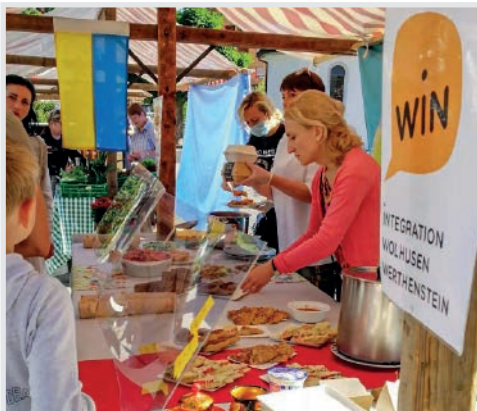
WIN Der Integrationsverein bereichert das Angebot!